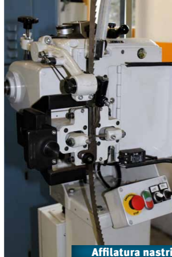
Affilatura nastri con refrigerante