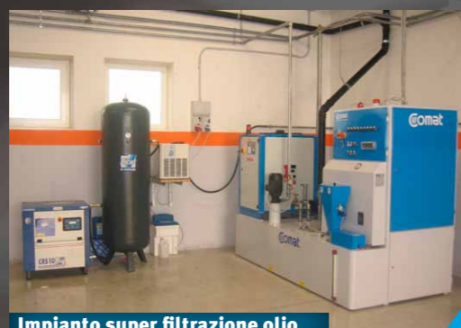
Impianto super filtrazione olio

Affilatura MATTEOTTI vi aspetta per soddisfare ogni vostra richiesta.