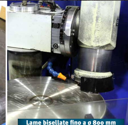
Lame bisellate fino a \varnothing 800 mm