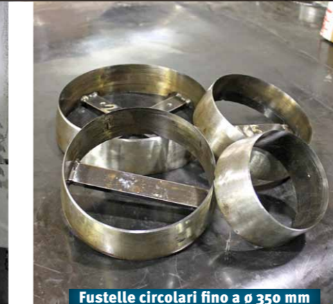
Fustelle circolari fino a \varnothing 350 mm