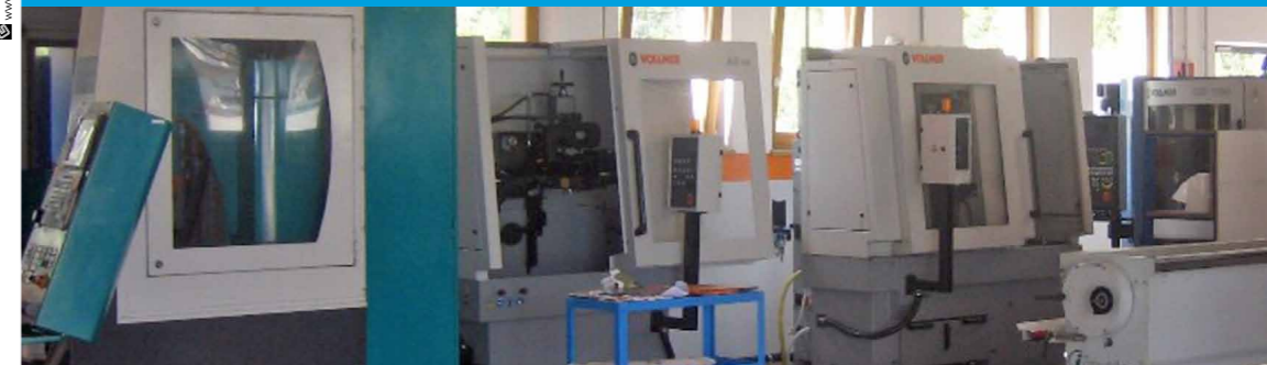
Affilatura - Ricambi