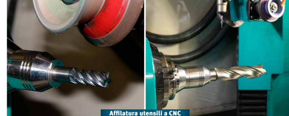
Affilatura utensili a CNC