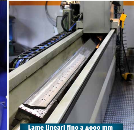
Lame lineari fino a 4000 mm